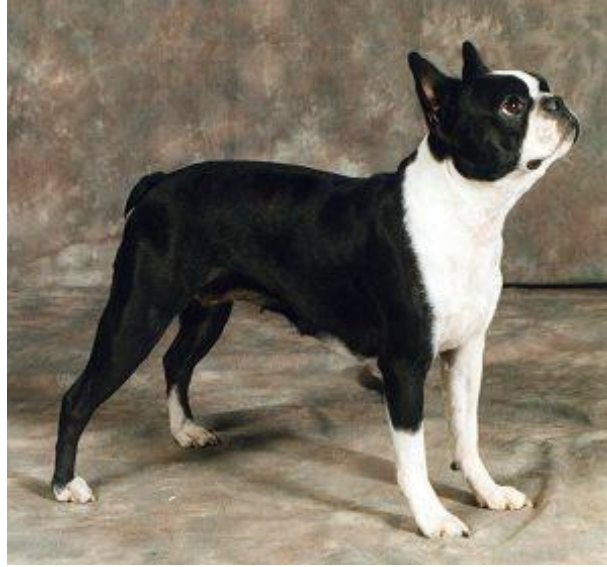
Boston Terrier hayat dolu ve zeki bir ırktır

Boston Terrier: Boston Terrier, Boston'un dövüş arenalarında kendini göstermeye başladığından bu güne büyük yol kat etmiştir. Bull ve terrier ile bulldog çaprazlamalarından elde edilen bu köpeklerin ataları diğer kuzenleri gibi İngiltere'den gelmiştir.1889'da yaklaşık 30 üretici Amerikan Bull Terrier Klubünü kurdu. Üretilen köpeklere sevenlerince " Yuvarlak yüzlü " ya da " Bull Terrier " adı verilmişti. Gerçek Bull Terrier üreticileri bu köpeklerin terrier, Bulldog üreticileri ise gerçek bulldog olmadığını idda ederek karşı çıktı. 1891'de ismi Boston Terrier'e çevrilmiş ve ilk standardı yazıldı. AKC tarafından ırk 1893 yılında tanındı.