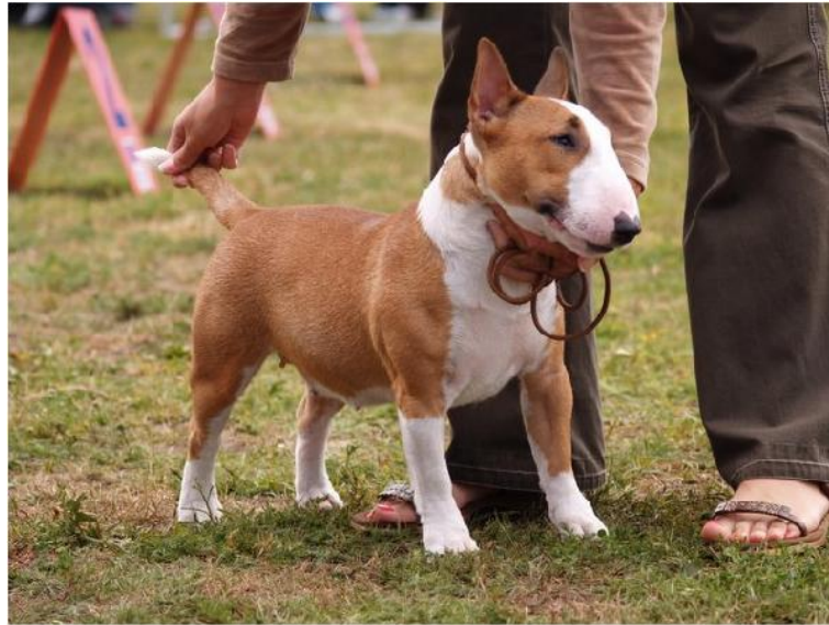
Minyatr Bull Terrier

Minyatr Bull Terrier: Minyatr Bull Terrier, kuzeni bull terrier ile boyut dıŐında aynı standarda sahiptir. Maksimum 35 cm olan MinBT neŐeli terrier karakteriyle Standart Bull Terrier'in kçük bir modelini isteyen aileler iŐin harika bir alternatiftir.